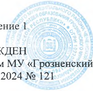
График проведения всероссийской олимпиады школьников в 2024-2025 учебном году Первый этап (школьный)

УТВЕРЖДЕН приказом МУ «Грозненский РОО» от 12.09.2024 № 121